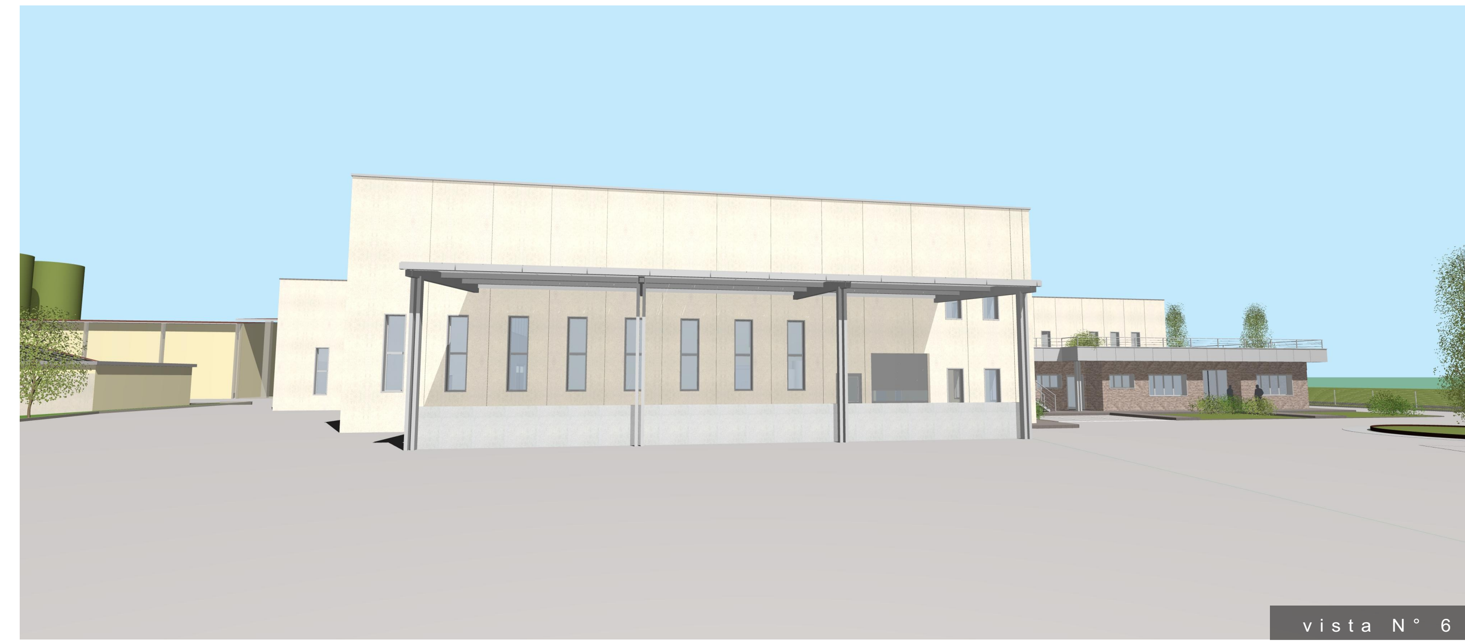
vista N° 6