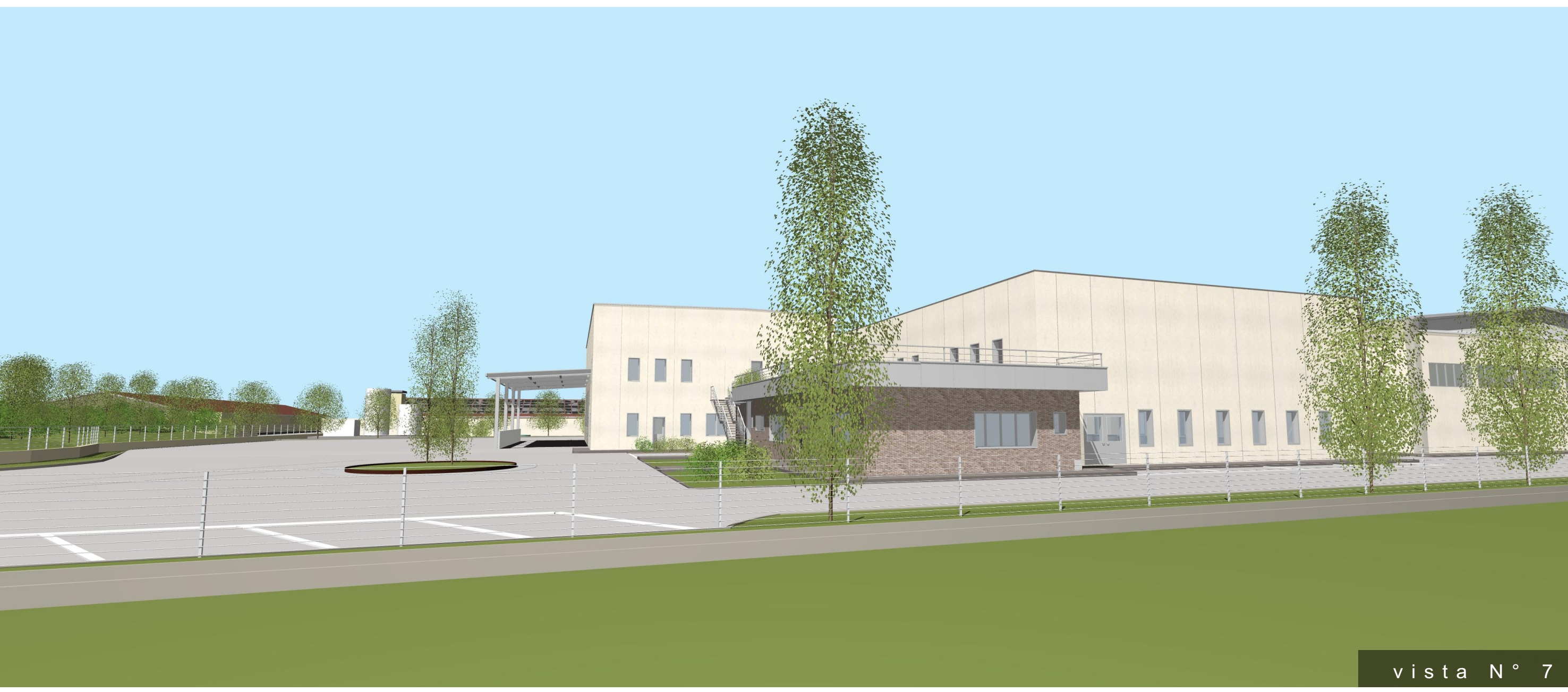
vista N° 7