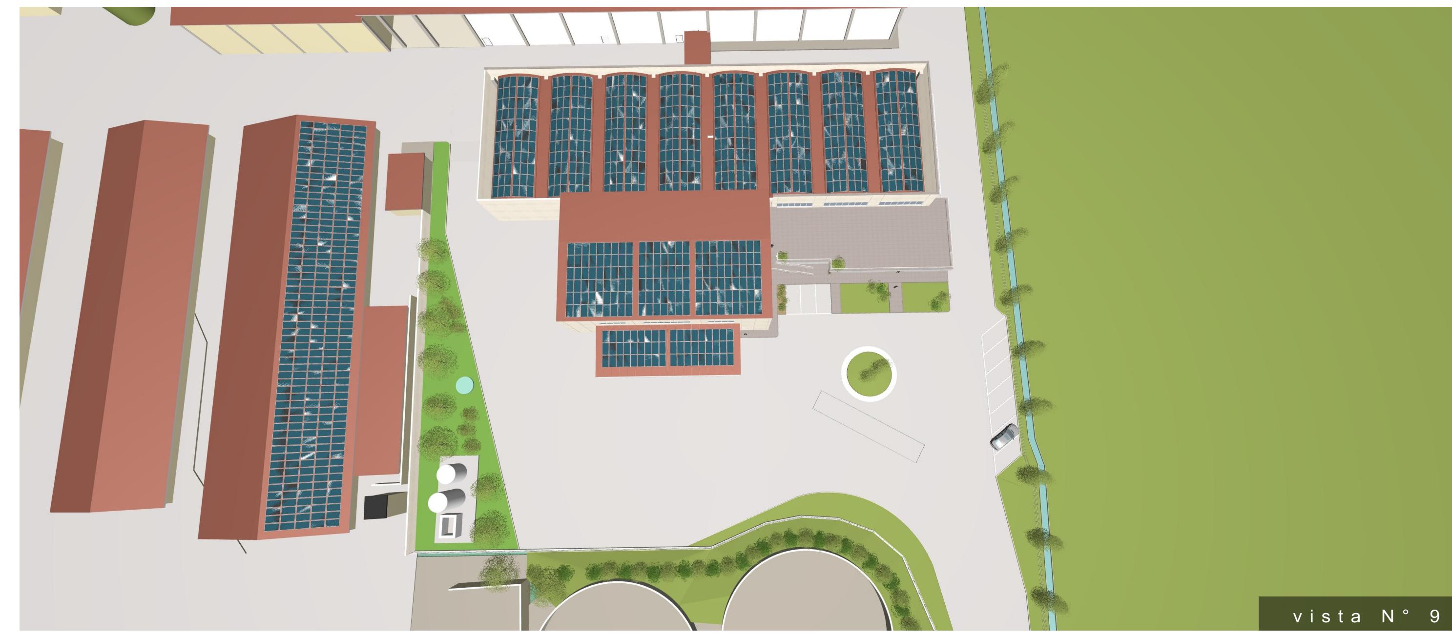
vista N° 9

COMMITTENTE CASEIFICIO S.ANTONIO S.r.l. Via Dugali mattina n. 2, Montichiari (BS)