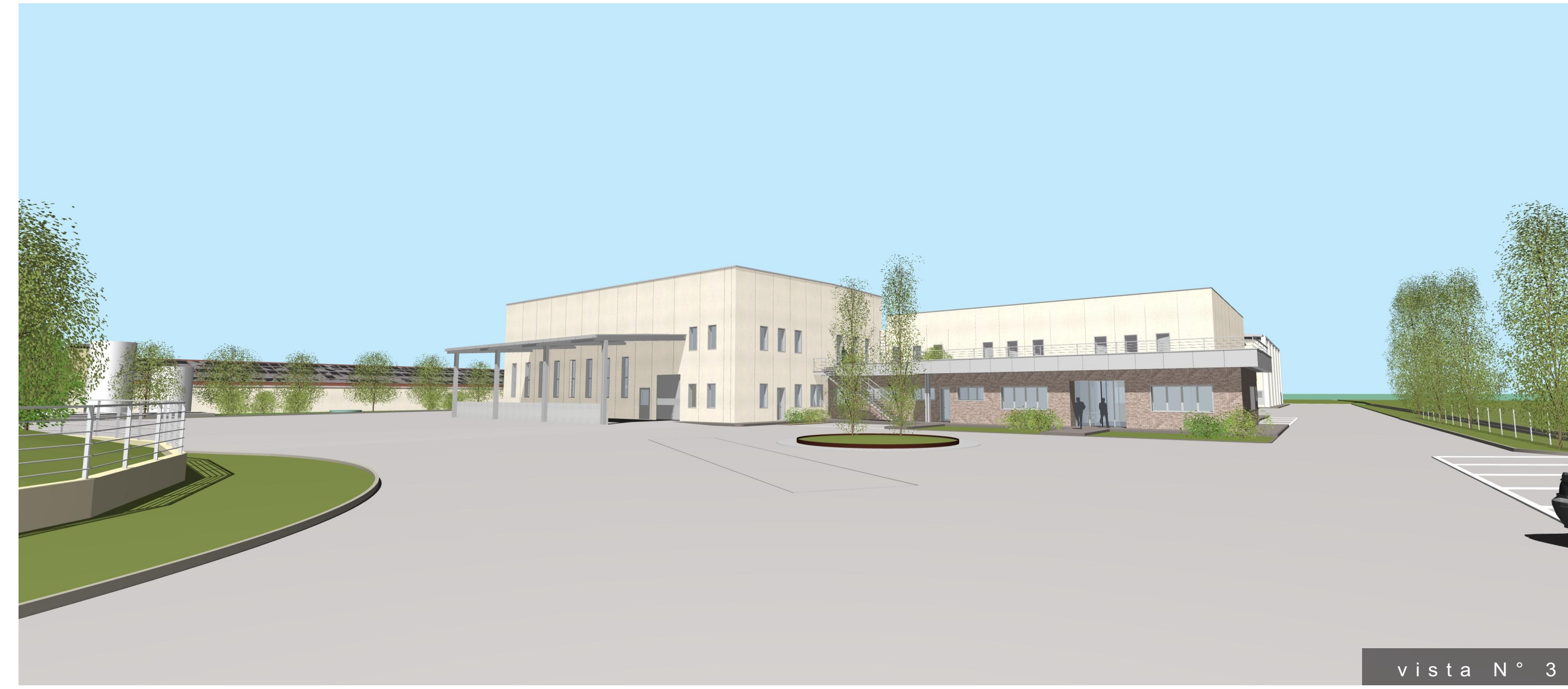
vista N° 3