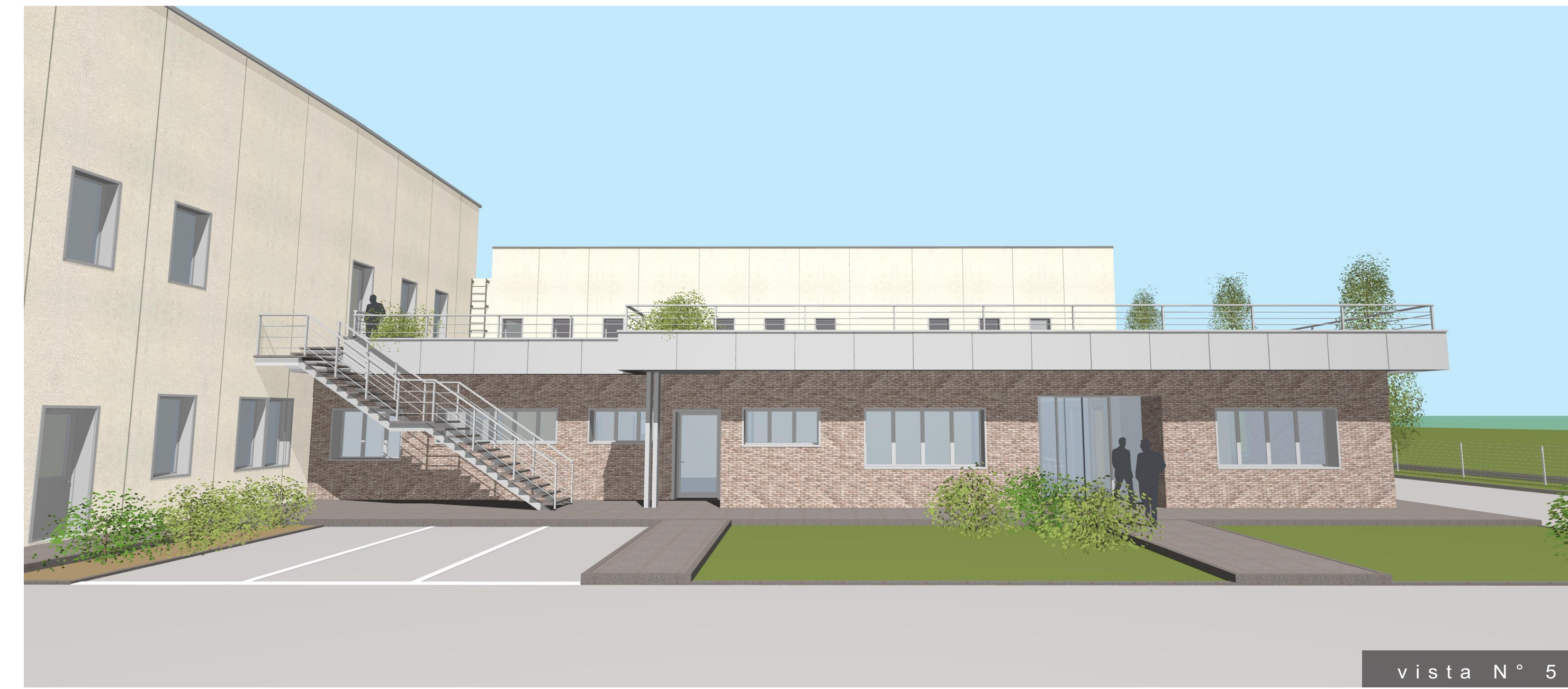
vista N° 5