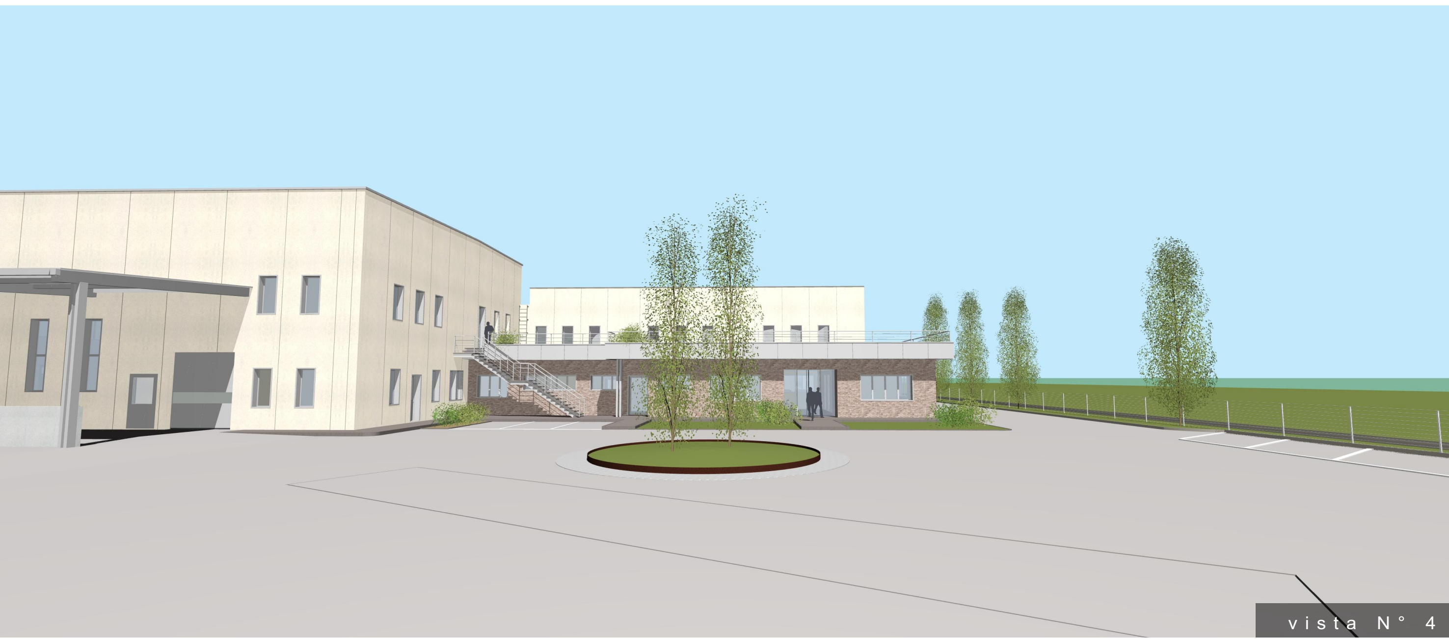
vista N° 4