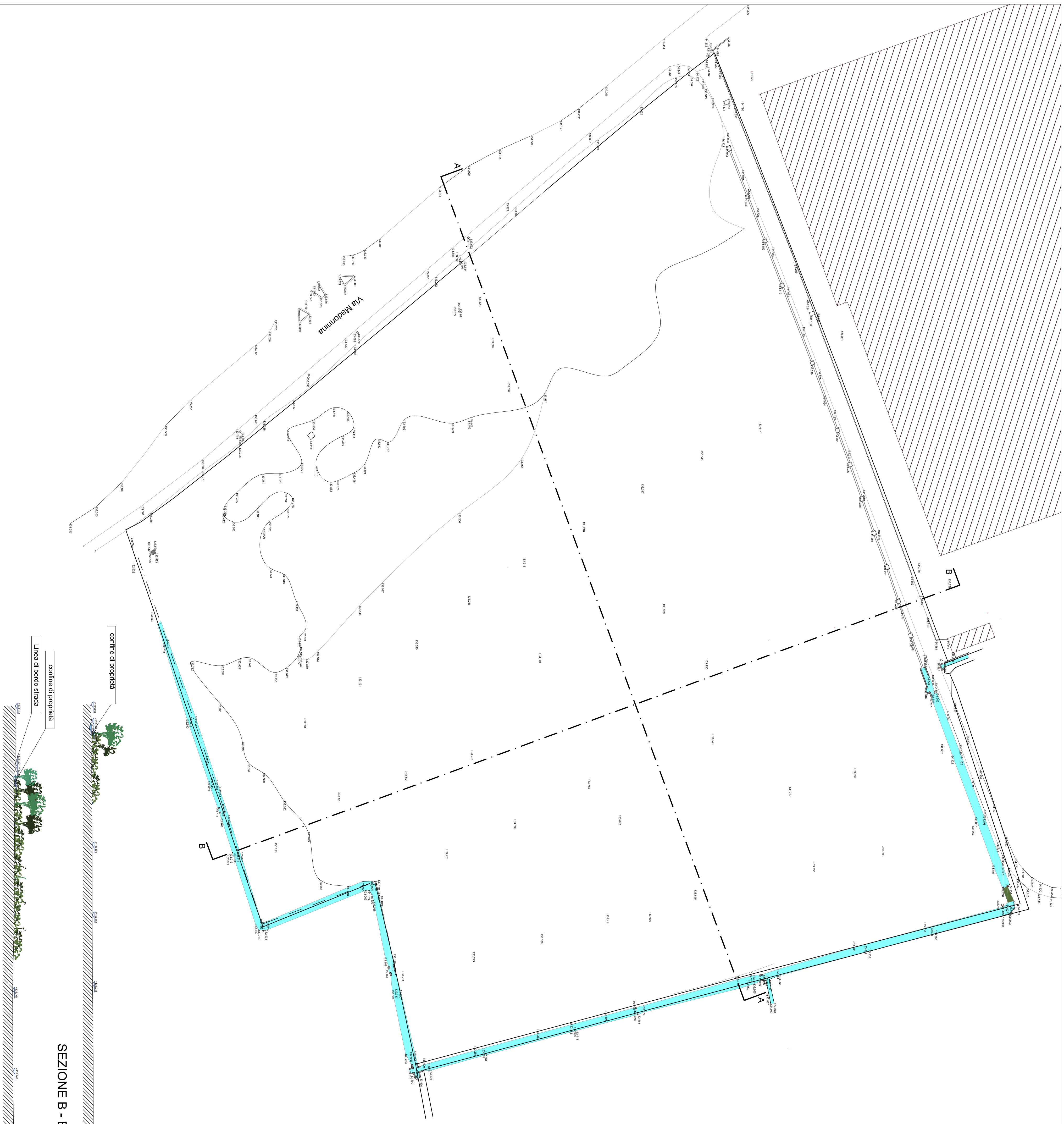
SEZIONE B - B